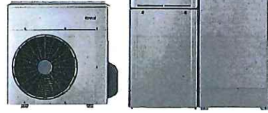
ハイブリッド給湯器 ECOONE