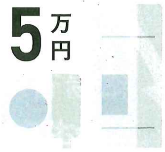
ヒートポンプ給湯器